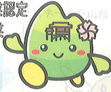
三徳山イメージキャラクター みとちゃん