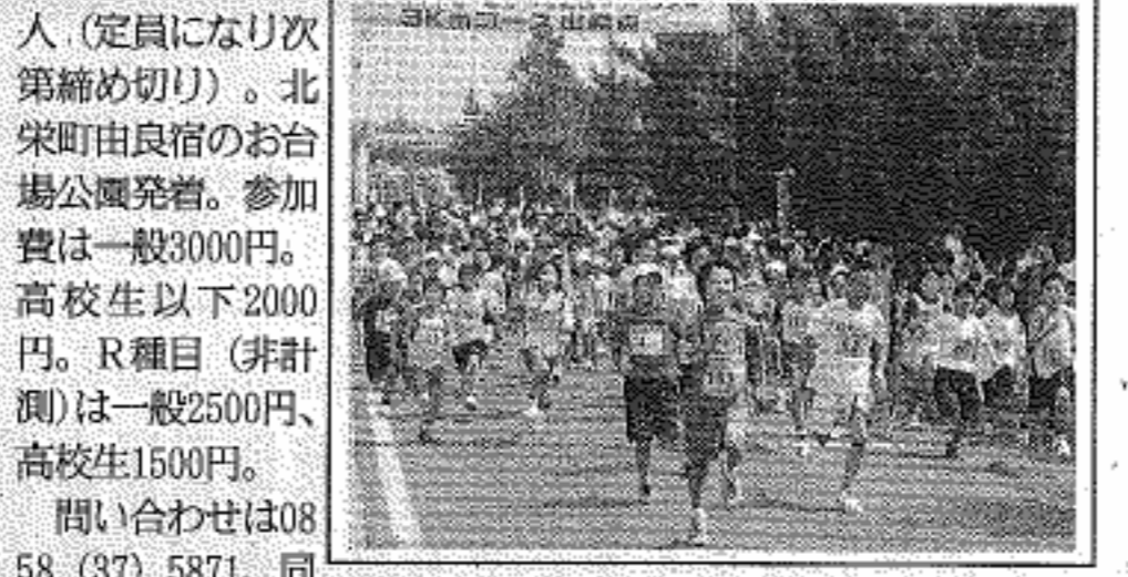
全国に名を誇る大栄スイカと砂丘長芋の畑の中を走るマラソン大会

名探偵コナンに会えるまち・北栄町で「第23回北栄町すいか・ながいも健康マラソン大会」が7月4日に開かれます。全国に名を誇る大栄スイカ、砂丘長芋の畑の中を楽しく走るマラソン大会に参加してみませんか。 募集は定員4000人(定員になり次第締め切り)。北栄町由良宿のお台場公園発着。参加費は一般3000円。高校生以下2000円。R種目(非計測)は一般2500円、高校生1500円。 問い合わせは0858(37)5871、同大会実行委員会事務局へ