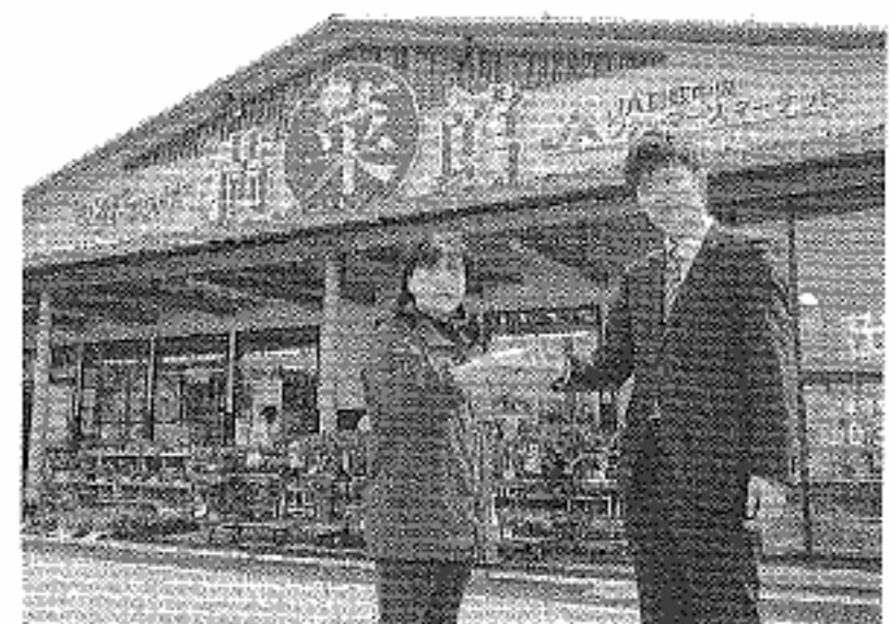
JA鳥取中央ファーマーズマーケット・旬鮮プラザ「満菜館」も協力。商品を出してモニターが始まる

「これらを広く募集し、プロジェクトチームが出品者」と面談、モニターング方法、内容などを双方合意のもとで進めたいと、商品のエンタリーされるように