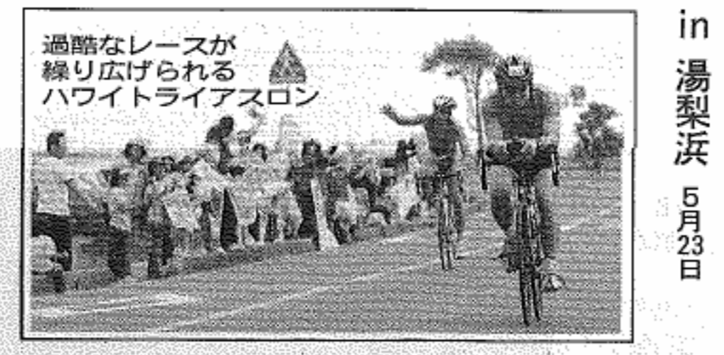
過酷なレースが繰り広げられるホワイトライアスロン

300人を超える選手と300人のボランティアが携わり、学生選手権中国地区予選、千葉国体中国ブロック各県代表選考会を兼ねた本格的な大会です。 ジュニアの部が新設され、未来のオリンピック選手を目指す中学生、高校生の戦いが見もの。本年度からJTU(日本トライアスロン連合)エイジラング対象大会に昇格し、日本各地から強豪が参戦します。皆さんで応援しましょう！ 問い合わせは0858(35)5383、ホワイトライアスロンIN湯梨浜事務局へ。