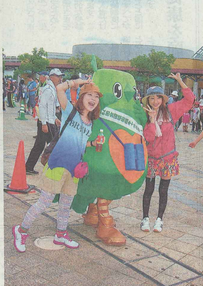
全国植樹祭のキャラクター・トッキーノと記念撮影する女性ウォーカー。トッキーノに負けないくらいおしゃれ