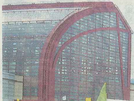
倉吉パークスクエア

大平山・燕趙園コースは、新緑あふれる大平山、東郷池の自然が楽しめる、日本最大級の中国庭園「燕趙園」を目指す。遥かなまち倉吉コースは玉川沿いにある白壁土蔵群周辺を巡るもので、風情のある町並み、そして漫画家・谷口ジローさん(鳥取市出身)の作品「遥かな