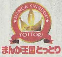
まんが王国とっとり

鳥取県内全域で開かれる「まんが王国とっとり」は、さまざまな関連イベントがめじろ押し！ 7月28日～8月26日、三朝町三朝のみささ美術館で「みんなだいきいすきアンパンマン やなせたかしの世界展」(新日本海新聞社