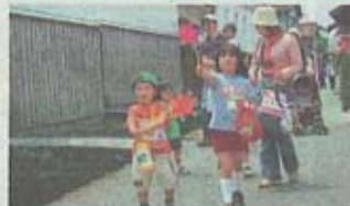
白壁土蔵群を歩く親子連れ(昨年の大倉)

円(当日2千円)。高校生以下無料。1日だけ、2日参加とも参加費は同額。障害のある方と介助者は半額。小学生以下は保護者の同伴が必要です。