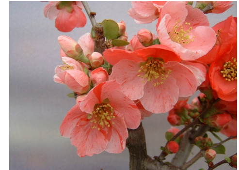
ぼけの花 花言葉『先駆者』